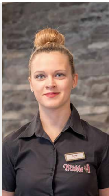
SPA - Managerin Neja Kosmetikerin & Masseurin

Tel.: +43 (0) 5256 / 6767 E-Mail: info@muehle-resort.at Hausintern: 100